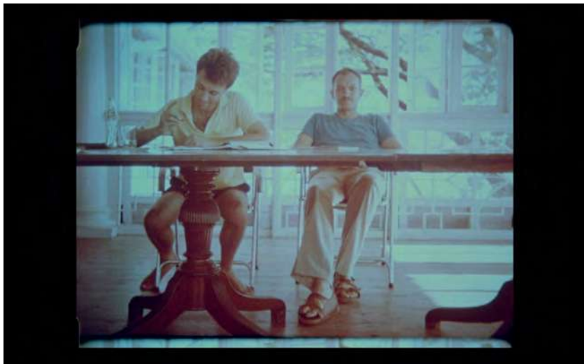
Electra-Pythagorus de Luke Fowler

Du samedi 21 au mercredi 25 mars L'Arlequin